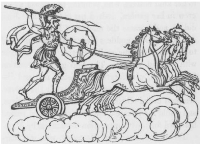
De oorlogsgod Mars

Het aantal woorden dat uit het Grieks of Latijn voortkomt, is enorm. Dat zijn niet allemaal moeilijke woorden uit de medische wereld of de politiek. Overigens ook de woorden medisch en politiek zijn klassiek. Medisch komt van het Latijnse woord voor dokter medicus en politiek van het Griekse woord polis dat stad of staat betekent. Andere afleidingen zijn de maand maart (genoemd naar de Romeinse oorlogsgod Mars ), president (voorzitter), radio (straal), biologie (leer van het leven), enz. Daarbij ken je ook veel klassieke woorden die niet eens zijn veranderd. Wat dacht je van: stadion , drama , aquarium , cursus , datum en museum ?