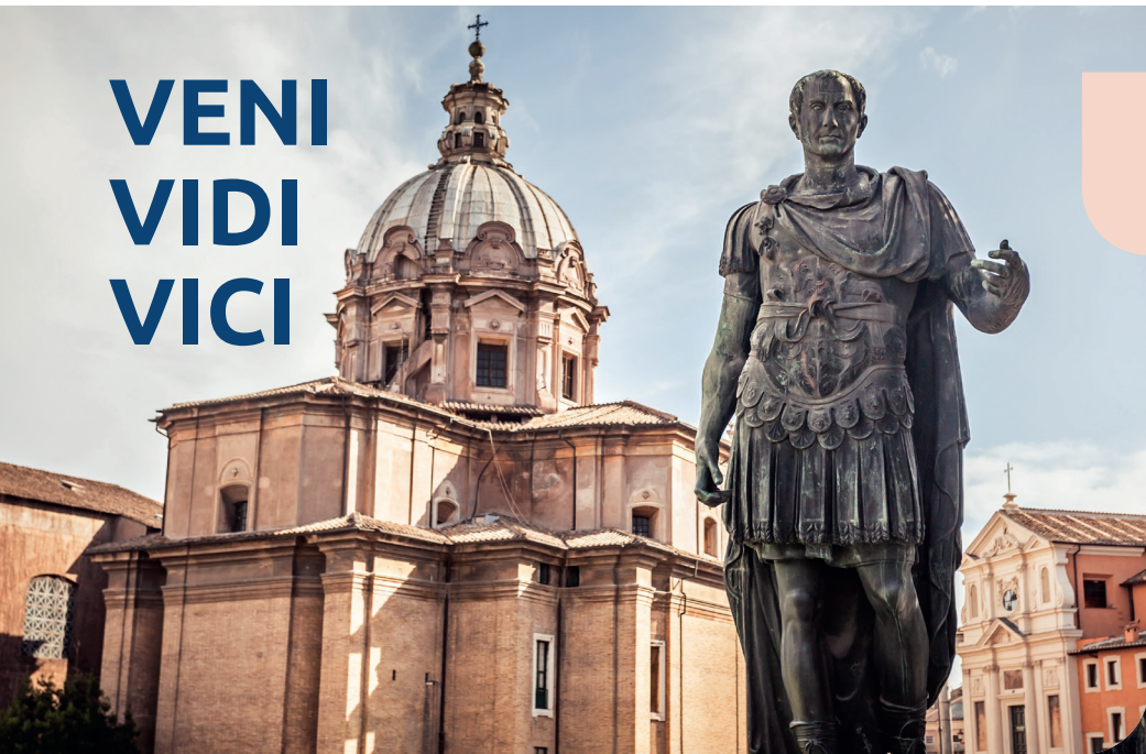
Caesar riep: "veni, vidi, vici": "ik kwam, zag en overwon", omdat hij zo snel veldslagen leverde.