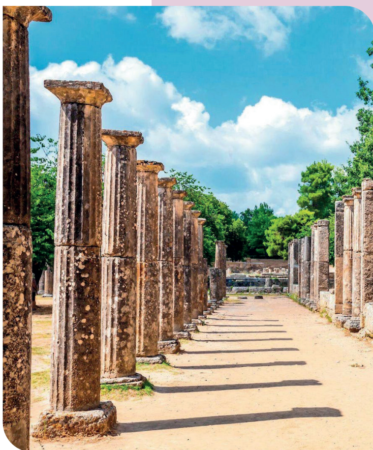
Het gymnasium was een oefenschool, waar je naakt ( gymnos ) aan sport deed.