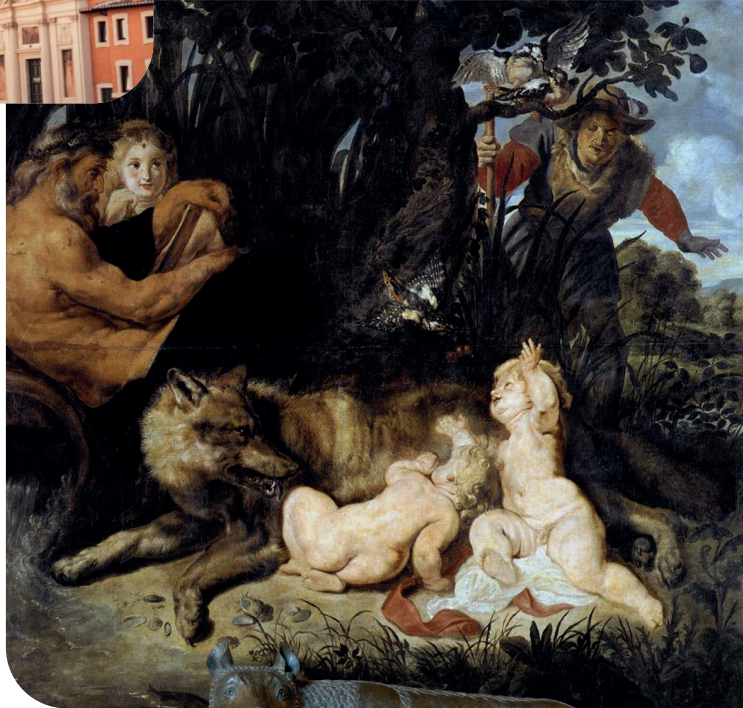
Romulus en Remus werden opgevoed door een wolf en stichtten Rome.

We hopen je enthousiast gemaakt te hebben voor het gymnasium en zien je graag terug tijdens de speciale gymnasiumavond!