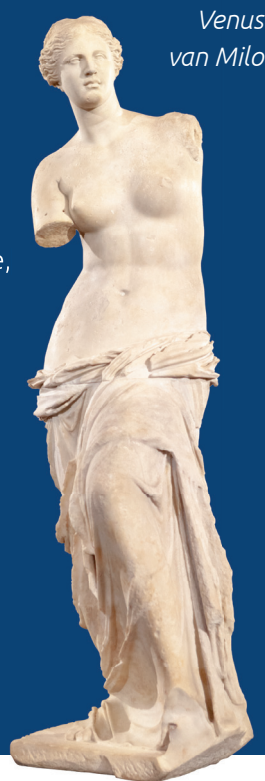
Venus van Milo

Training in argumenteren en debatteren. Ook spreken is een onderdeel. Deelname aan regionale voorrondes en een landelijke wedstrijd.